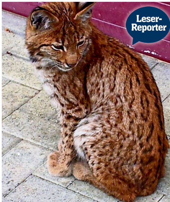
Der Luchs sass seelenruhig auf dem Vorplatz. EDWARD BURCH

morgen Mittwoch ans «Lozärn lacht» ins Kleintheater (ab 20 Uhr). Gleichorts tritt am Donnerstag auch Stéphanie Berger mit «Hölleluja!» auf. MME Comedy.ch/luzern-lacht